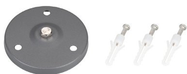
Рис. 2. Основание для установки на поверхность (арт. 024890)