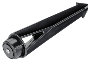
Рис. 3. Основание для установки в грунт (арт. 024888)