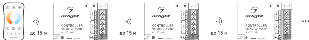
Рисунок 2. Ретрансляция сигнала от пульта ДУ (до 15 м на открытом пространстве)

Расстояние между контроллерами на открытом пространстве может достигать 15 м.