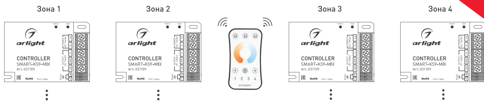
Рисунок 3. Вариант построения системы с 4-зонным пультом дистанционного управления

3.10. При использовании многозонных пультов ДУ или панелей можно построить разветвленную систему управления (рисунок 3).